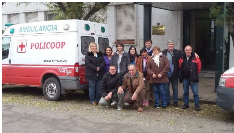
Fig. 1 – Equipo de la cooperativa Policoop.

A fin de llevar a cabo una transferencia de tecnología a una entidad de salud de la Economía Social y Solidaria y validar en la práctica concreta su potencial, se consideró como caso testigo el Policlínico Cooperativo Policoop (Figura 1).