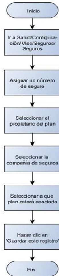
Fig. 2. Diagrama de creación del plan de salud.

Además, se desarrolló un módulo de facturación en lote, utilizado para facturar todos los planes de salud de los afiliados. Este módulo posibilita una facturación masiva para todas las personas que pertenecen a un mismo plan.